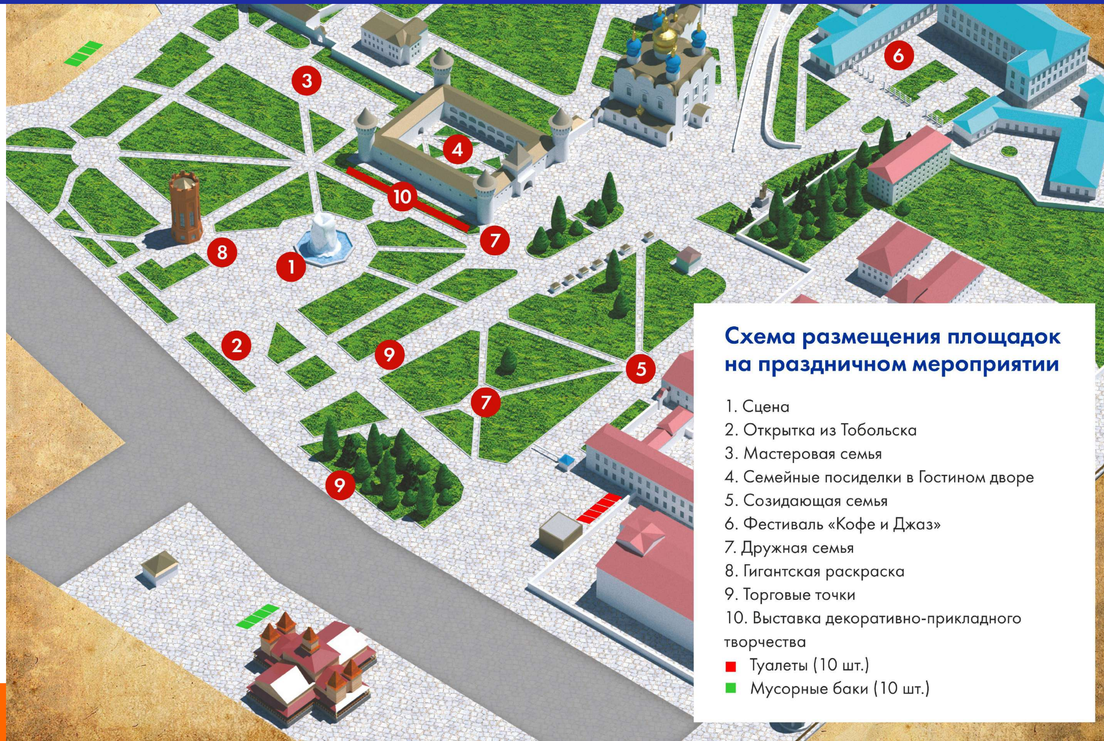
Схема размещения площадок на праздничном мероприятии